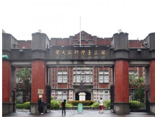
台湾 国立台湾師範大学