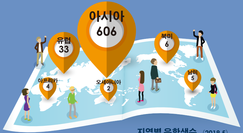
지역별 유학생수 (2019.5)