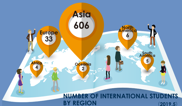
NUMBER OF INTERNATIONAL STUDENTS BY REGION (2019.5)

【学内】 ・学生寮(¥4,700/月) ・国際交流会館(約¥30,000 ~ /月) 【学外】 ・国際学生宿舎 [調布、日野] (約¥50,000 ~ 60,000/月)