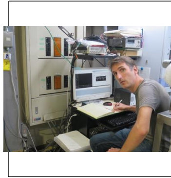
スペクトル測定中 / during a spectrum accumulation