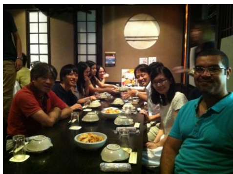
welcome party in the lab